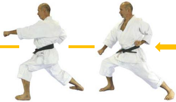
( 20 ) Oi-Zuki Links