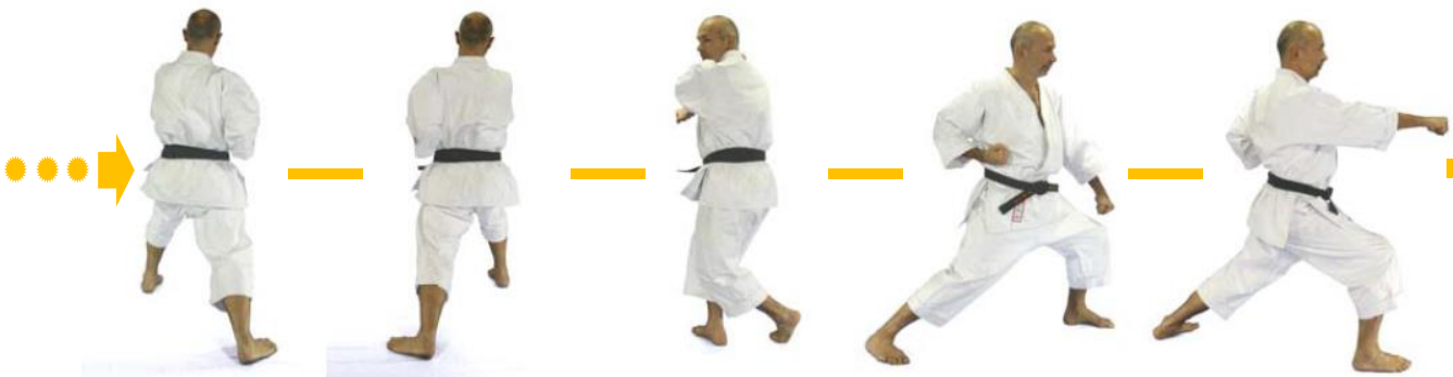
( 15 ) Oi-Zuki Links