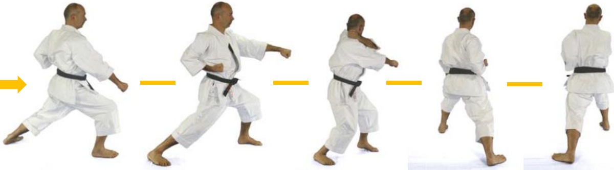
( 11 ) Gedan Barai Rechts 180°