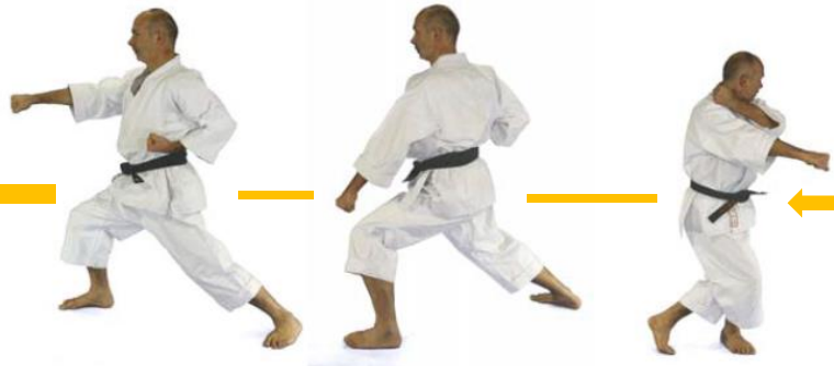
⑩ "Ju" Oi-Zuki Rechts

( In den Kommandos wird nicht über 10 hinausgezählt, daher werden ab 10 die Schritte normal weitergezählt )